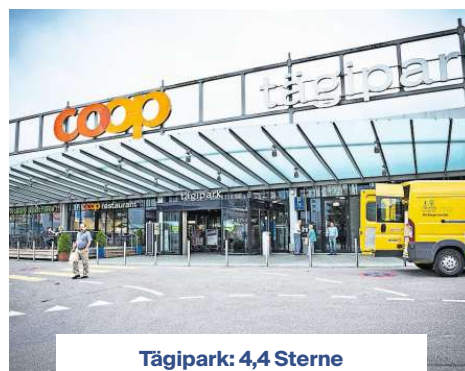
Tägi park: 4,4 Sterne

«Das schönste Gymnasium.»