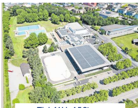
Tägi: 4,1 bis 4,5 Sterne

«Ein Einkaufszentrum, wie es viele gibt.»