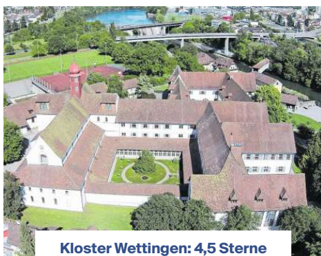
Kloster Wettingen: 4,5 Sterne

Auch das Rathaus wird bewertet. Fünf Sterne gibt es für: «Man hört viel von Beamten, aber ich kann vom Rathaus Wettingen nur Gutes berichten. Hilfsbereite Menschen, freundlich und korrekt.» Die Meinungen gehen durchaus auseinander. Einen Stern gibt es für: «Freundlichkeit tut nicht weh» oder «Muss ich ja wohl nichts schreiben. Oder?» Insgesamt kommt die Behörde aber doch auf 4,4 Sterne.