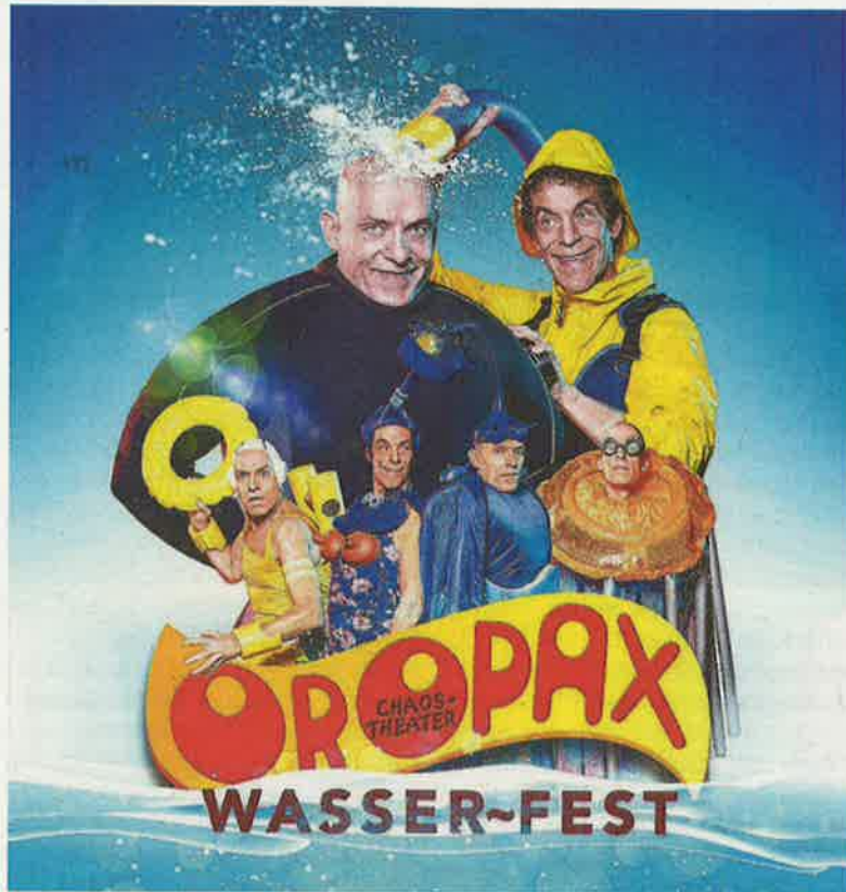
Duo Oropax zu Gast im Gartenbad Tägi.

Tägi Wettingen, Freitag, 23. Juli, 20.30 Uhr.